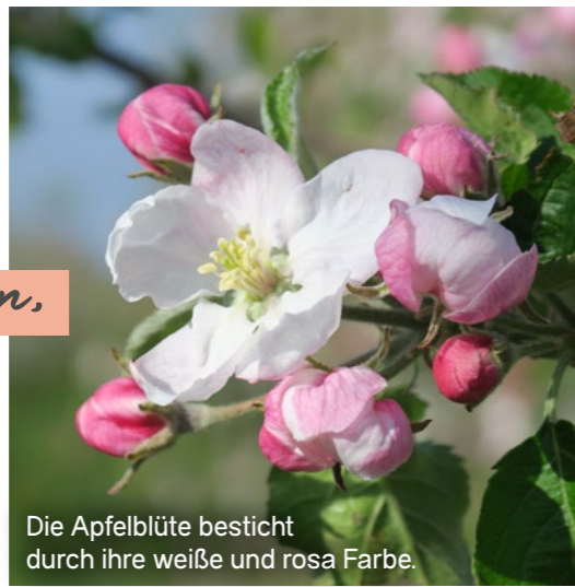
Die Apfelblüte besticht durch ihre weiße und rosa Farbe.