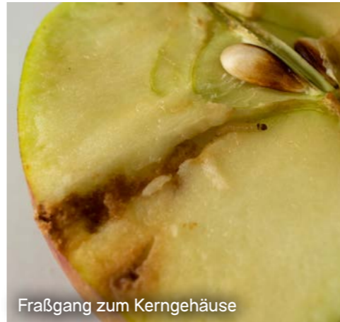
Fraßgang zum Kerngehäuse

Von der Larve, die sich frisch aus dem Ei geschlüpft durch allerhand Köstlichkeiten futtert und letztendlich zu einem Schmetterling wird, hat wahrscheinlich jeder schon mal gehört. Auch der Apfelwickler, im Volksmund Obstmade genannt, ist ein Schmetterling, der sich im Sommer in Massen durch das Apfelbuffet futtern würde – wenn wir ihn denn ließen. Im späten Frühjahr legen die Apfelwicklerweibchen ihre Eier auf die Blätter und Früchte der Apfelbäume. Nach kurzer Zeit schlüpfen die Larven aus den Eiern und fressen sich so lange durch die Äpfel, bis auch sie zum Schmetterling werden – je wärmer es ist, desto schneller geht es vonstatten. Schaffen sie diese Entwicklung bis zum 1. August, kann die erste Generation im selben Jahr noch eine zweite Generation bilden und noch mehr Äpfel nehmen Schaden.