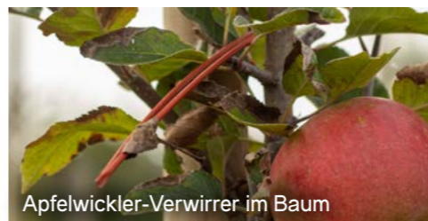
Apfelwickler-Verwirrer im Baum