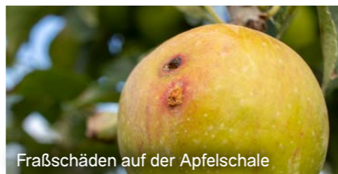
Fraßschäden auf der Apfelschale